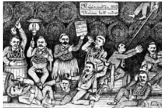
Skopmyndin sýnir templara hella niður þeim vinbirgðum sem til voru á nýársnótt 1915, þegar sölubann áfengis gekk í gildi.

Oft áttu lögregluþjónar í erfiðleikum með flutning handtekinna manna, en í Reykjavík var smíðaður handvagn með kistu til þess að flytja ölvaða menn og ósjálfbjarga. Kistan var hinsvegar svo stutt að