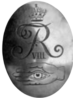
Beltisyllgja næturvarða 1906 - 1912.

Fyrsta einkennistákn íslenskrar lögreglu er hönd með auga greiptu í lófa. Uppruni táknins er ævafornt og hefur verið rakinn til Mið-Austurlanda, allt aftur til tíma Gamla testamentisins og jafnvel enn lengra. Höndin táknar nærveru guðdómsins, sem hin dæmandi hönd, hin hjálpanði hönd og hin hlífandi hönd, en augað var hinsvegar tákn um guðdómsins alsjáandi og ávallt vakandi og verndandi auga. Þessi tákn eru þekkt í kristni. Áður stóðu þessi tákn ein og sér en fyrsta þekkt dæmi þess að augað sé felld inn í höndina er líklega frá 14. öld. Í fyrstu var augað í lófa uppréttrar handar en síðar breyttist táknin í þá veru sem sést á hnöppum einkennisbúninga dönsku og íslensku lögreglunnar; augað á útréttri hönd.