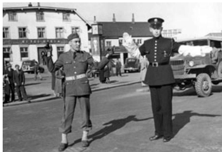
Bandarískur hermaður og íslenskur lögregluþjónn við umferðarstjórn á tímum seinni heimsstyrjaldarinnar.

Eftir breytinguna skyldi lögreglustjóri hafa á hendi lögreglustjórn, meðferð sakamála og almennra lögreglumála og dómsmeðferð þeirra. Þá heyrðu margvísleg málefni áfram undir embætti lögreglustjóra, önnur en bein lögregluverkefni.