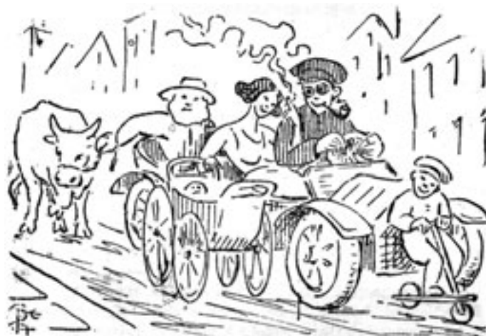
Hraðinn samkvæmt lögreglusamþykktinni.

Í lögreglusamþykkt fyrir Reykjavíkurkaupstað, sem tók gildi árið 1891, var að finna einu umferðar-